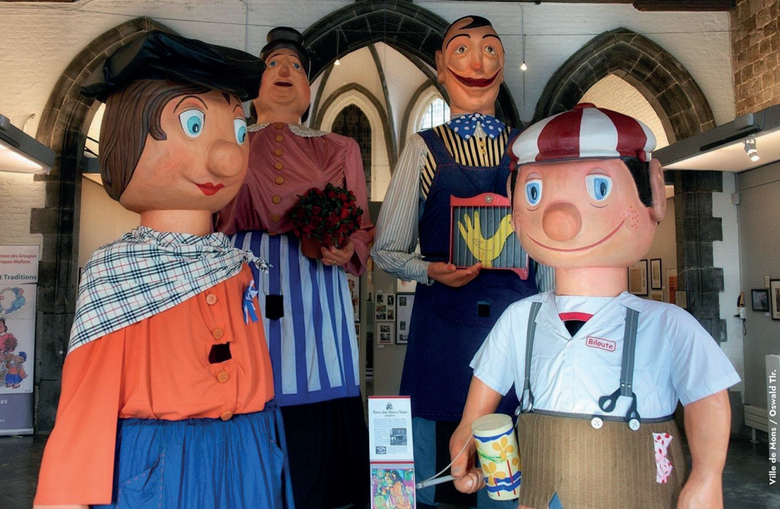
Association Royale du Patrimoine et des Traditions de Messines | Ne pas jeter sur la voie publique