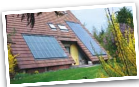
J.P. / F.L.

Pour conclure, soulignons également le soutien de la Ville au salon Energy Mons qui se déroulera en octobre prochain au Lotto Mons Expo. On en reparlera naturellement.