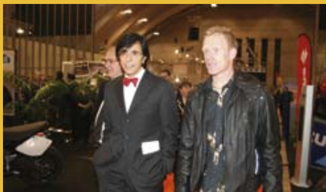
Le Bourgmestre Elio Di Rupo en compagnie d'une légende du motocross belge : Joel Smets, quadruple champion du monde en 500 cc.