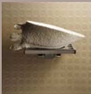
'boire dans les mains d'un inconnu', porcelaine coulée dans un gant trouvé, support métallique, longueur 15 cm, 2007.