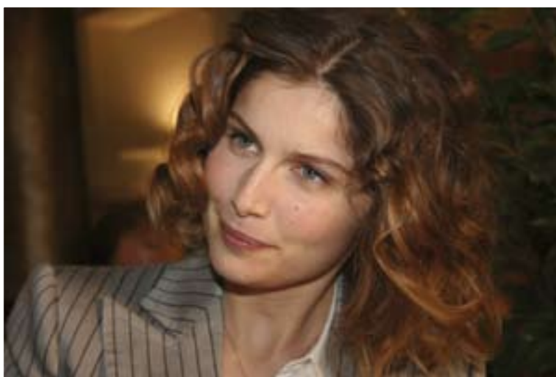
Laetitia Casta, invitée vedette du Gala d'ouverture, venue présenter son film «La jeune fille et les loups» en avant-première. Difficile de rester indifférent au charme de l'actrice française.