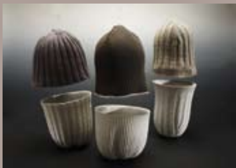
'bonnets-bois', porcelaine coulée dans des bonnets, hauteurs des bols : de 14 à 20 cm, 2006-2007.