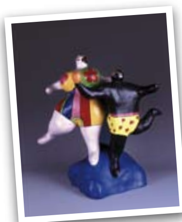
Collection Duvivier Niki de Saint-Phalle [« Nana » Les danseuses], [1981] APC 1176. Donation Maurice Duvivier, collection de la Communauté française de Belgique, mise en dépôt au BAM. © Vincent Everarts et L'Atelier de l'Imagier. © SABAM Belgium 2008.