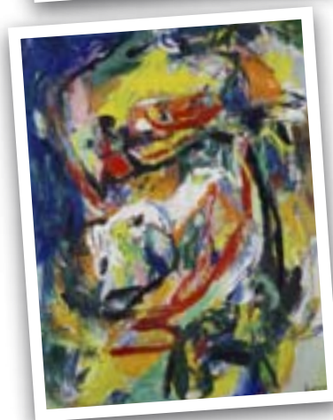
Collection Neiryck Asger Jorn L'infinie suffisance, (1965) © Philippe de Formanoir