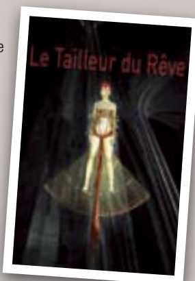
L'enfant-Dieu Dessin © Claude Renard