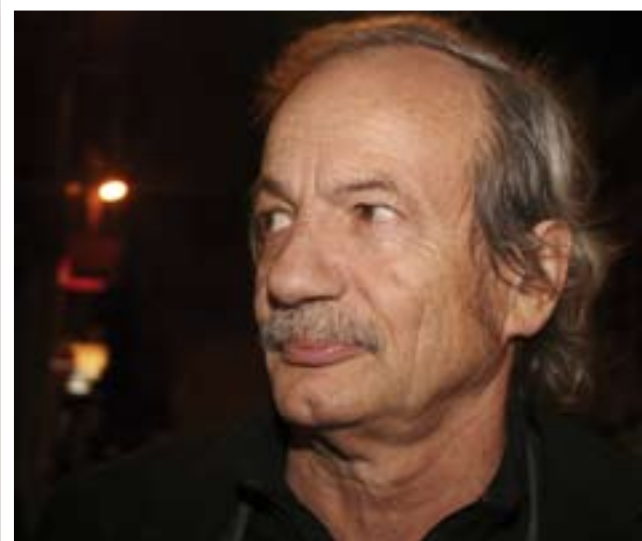
Présent également lors du Gala d'ouverture au Théâtre Royal, le grand acteur Patrick Chesnaix, très à l'aise parmi les festivaliers.