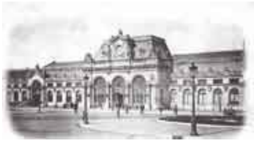
la gare au début du siècle passé