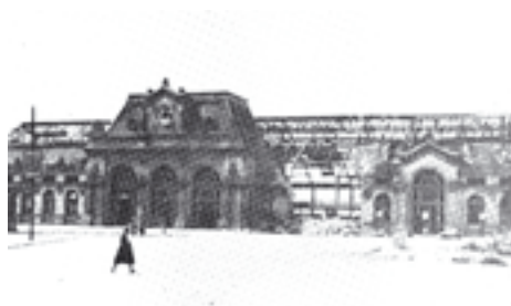
Après le bombardement durant la Seconde Guerre Mondiale...