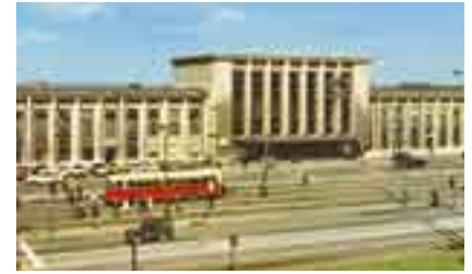
Depuis sa reconstruction peu après la Seconde Guerre Mondiale, la Gare de Mons n'a pas beaucoup changé de par son architecture.