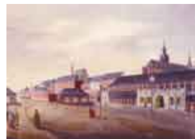
A l'époque où la Gare de Mons n'en était pas encore tout à fait une.

Au terme du concours, le nom du gagnant est connu : l'espagnol Santiago Calatrava.