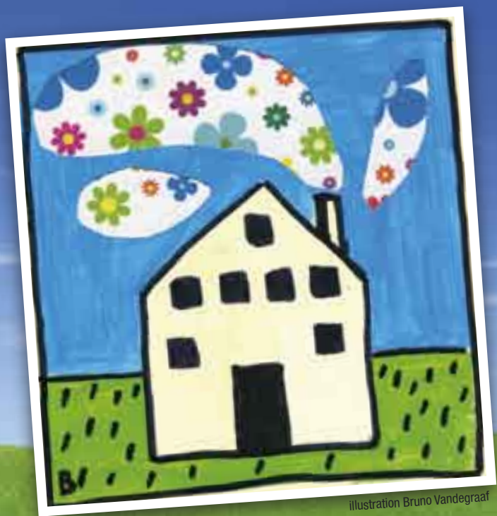
illustration Bruno Vandegraaf

A l'heure où la plupart des Villes semblent progressivement gagnées par la fièvre de la « durabilité », à l'heure où un wallon sur cinq connaît le concept d'empreinte écologique, à l'heure où le développement durable est devenu un crédo, la Ville de Mons est désormais bel et bien engagée dans la course.