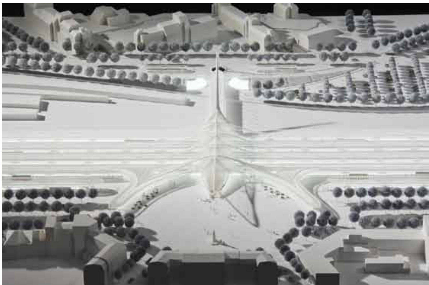
Maquette de la Place Léopold, version «Calatrava» - © Santiago Calatrava