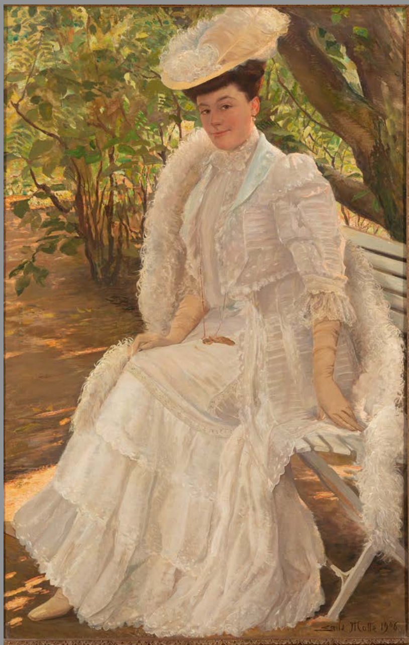
Dames blanche - art - ill.

Emile Motte (Mons, 1860-Schaerbeek, 1931), a étudié à Mons, Anvers et Paris et fut l'élève d'Antoine Boulard à qui il succéda à la direction de l'Académie de Mons (1899-1928), où il est titulaire du cours de peinture. Il fonde ainsi toute une jeune école montoise avec Anto Carte, Louis Buisseret, Pierre Dequenne... L'Artothèque conserve déjà un de ses plus beaux tableaux « Aux temps des aïeux » (1897) qui synthétise toute sa maîtrise technique et ses influences esthétiques. Nul doute que « La Dame en blanc » viendra avantageusement compléter l'ensemble d'œuvres du XIXe siècle montois. Ce portrait d'une extrême finesse représente une femme assise avec élégance sur un banc, à l'ombre d'un arbre. Peint en 1894, il appartenait à la grand-mère maternelle de M. Bedoret et témoigne de cette période où la photographie n'a pas encore supplanté la peinture.