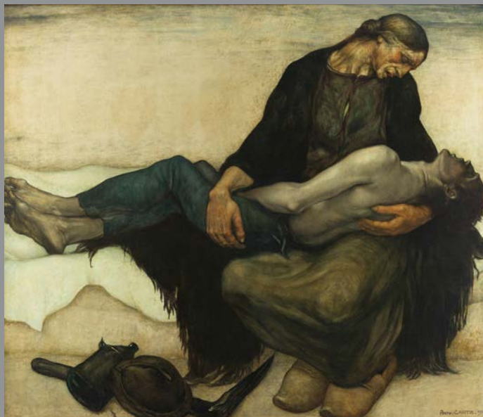
Arno Carle, La Prière

C'est l'occasion de (re)découvrir la vitalité et la diversité de la création plastique et artistique à Mons et dans sa région tout en s'inscrivant dans la tradition d'ouverture prônée par le Bon Vouloir depuis son origine.