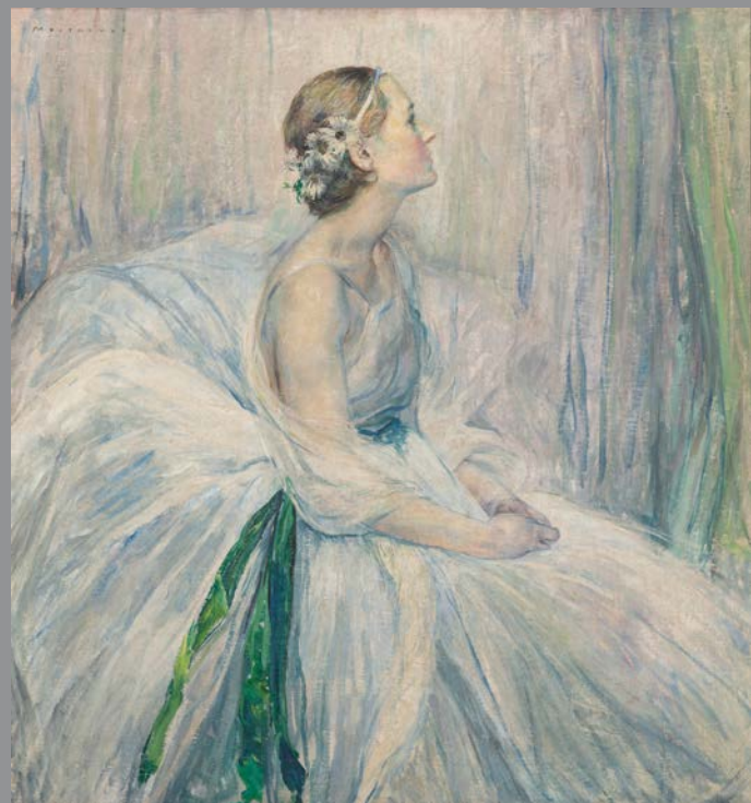
Alfred Moiroux, Bonne nuit au repos