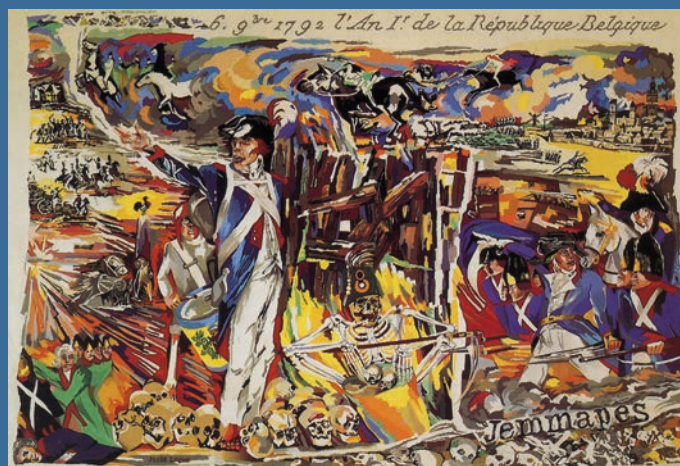
Carte postale d'une tapisserie de Jeanne-Marie Logier pour le Bicentenaire de la Bataille de Jemappes en 1992.

voie de communication à ce parc, une large avenue, venant de la grande voirie y sera aménagée, de façon que tout l'ensemble soit admirable, grandiose, imposant. »