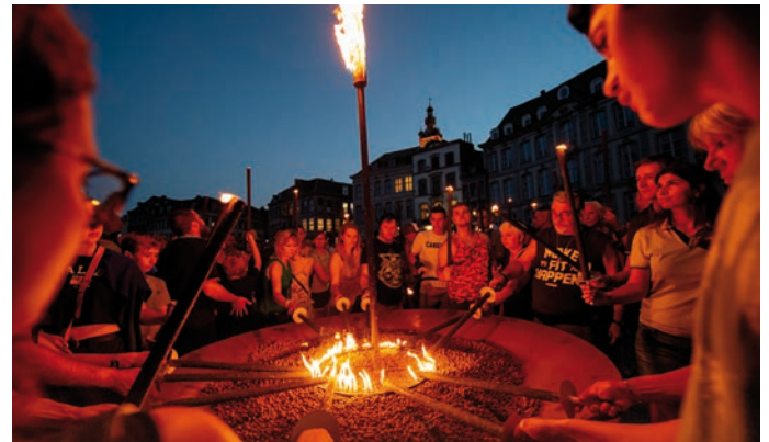
Ville de Mons