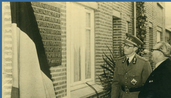
Le Roi Baudouin et le premier ministre Achille Van Acker devant la plaque célébrant le 100 000 e bâtiment construit par la Société nationale des habitations à bon marché à Jemappes, rue des Martyrs.

À partir des années 1950, Jemappes voit se construire des cités, principalement via la Société coopérative « Le Foyer Jemappien » (jusqu'en 1956) puis via la Société régionale de logement du Borinage (SORELOBO), devenue la société publique « Toit et moi » (depuis 2004). Ces cités comprennent aussi bien des maisons que des immeubles à appartements : Sur le Campiau, 369 logements forment la Cité de la Francophonie (construite entre les années 1950 et 1970) et les deux tours de la Cité du Coq sont érigées en 1977.