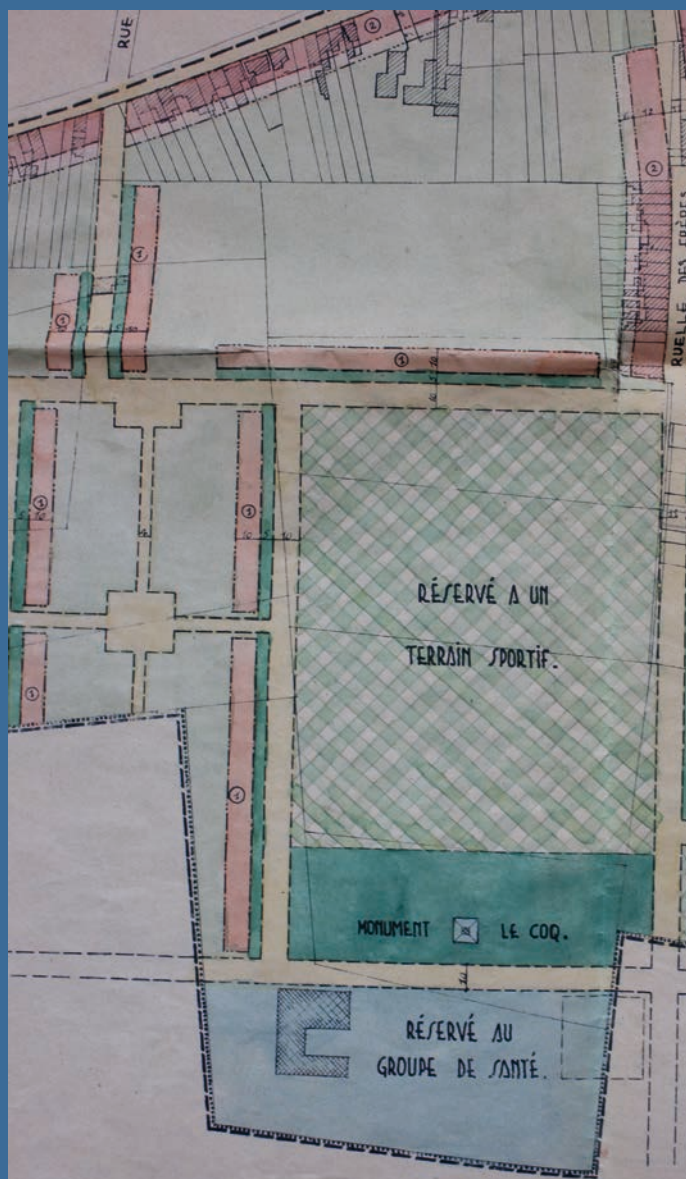
Extrait du plan particulier d'aménagement n° 1 de 1949 concernant les alentours du Monument au Coq.

Dans les années 1920, Jemappes fait face à une crise du logement : une politique de lutte contre les taudis provoque la fermeture et la démolition de nombreuses habitations. Il fallait, selon les mandataires, créer des logements en quantité et de qualité suffisante pour éviter de voir partir les Jemappiens vers d'autres localités en quête d'un meilleur logis. Dans un premier temps, des baraquements provisoires sont fournis par la Fondation Roi Albert pour loger les familles en difficulté. Au Campiau, c'est même toute une cité qui se crée, le long de la rue Croisette : dans un des baraquements, la commune installe même une école communale, reconstruite en dur en 1951 ! Le développement du quartier commence et, en 1938, un plan d'urbanisation définit les grandes lignes pour l'expansion de l'habitat au Campiau.