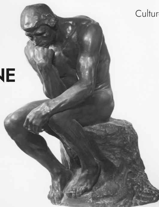
Le Penseur, 1881-1882 – Bronze, fonte J. Petermann 1899 H. 71 x L. 37 x P. 61 cm – Bruxelles, musées royaux des Beaux-Arts de Belgique, inv. 3517.