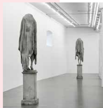
Berlinde de Bruyckere – L'Arcangelo

la Belgique. Ses impressionnantes sculptures, comme les archanges, permettent d'offrir un nouveau regard, une perception enrichie, de l'œuvre de l'artiste français. Un véritable dialogue se crée entre l'œuvre d'Auguste Rodin et le travail de Berlinde de Bruyckere.